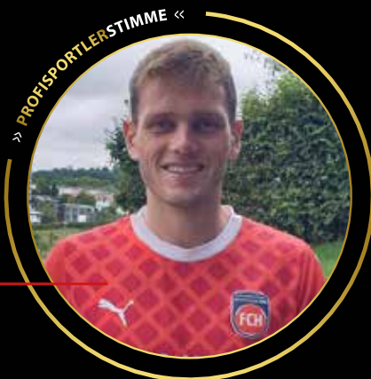
>> PROFISPORTLERSTIMME <<

... ich als Magdeburger Junge die Herausforderungen des Profisports kennengelernt habe und meine Erfahrungen nutzen möchte, um anderen Sportlern auf ihrem Weg zu helfen und unsere SAMFORCITY Gemeinschaft zu stärken.