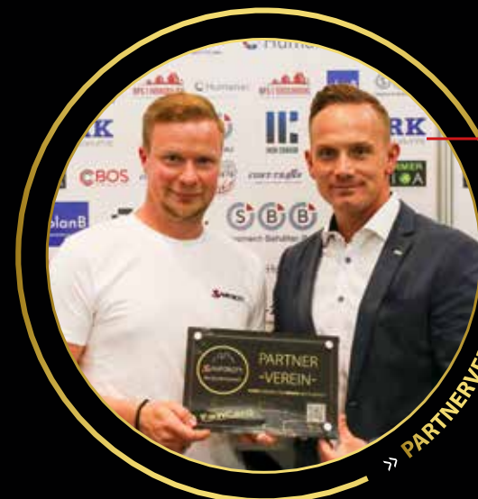
>> PARTNERVEREINSTIMME <<

... wir als Partnerverein von SAMFORCITY den Sport in Sachsen-Anhalt fördern und entwickeln möchten. Gemeinsam schaffen wir eine Zukunft, in der jeder Sportler die Unterstützung erhält, die er verdient.