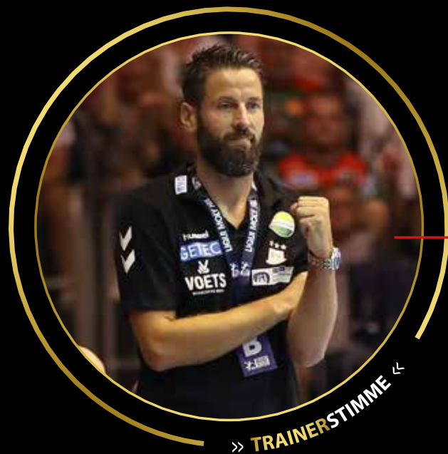
>> TRAINERSTIMME <<

SAMFORCITY Menschen, Sport und Wirtschaft zu einem Netzwerk verbindet, das genutzt wird.