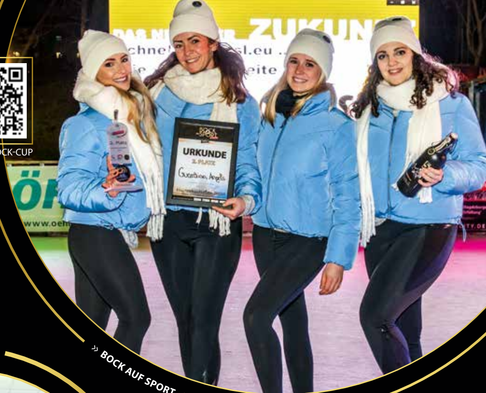
» BOCK AUF SPORT • EISSTOCKSCHIESSEN «