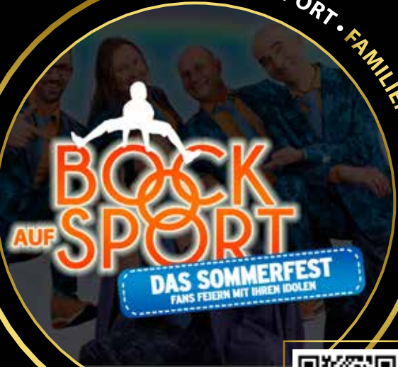
» BOCK AUF SPORT • FAMILIENFEST «