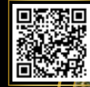
» WEIHNACHTSBAUMSCHLAGEN «