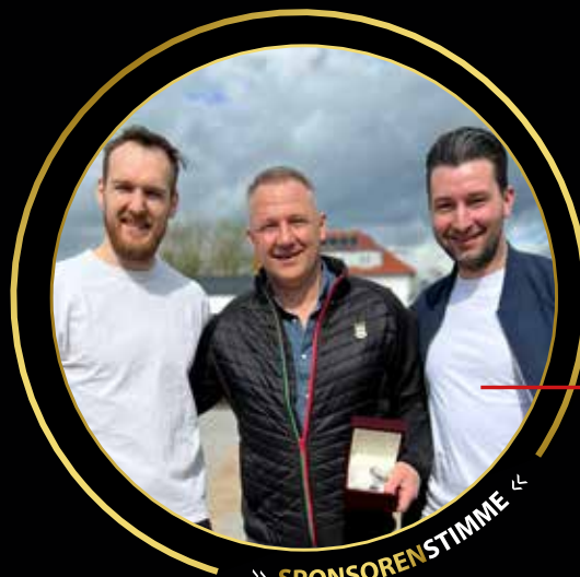
>> SPONSORENSTIMME <<

Fußballprofi beim 1. FC Heidenheim (Bundesliga)